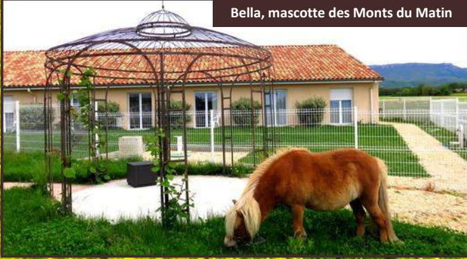
Bella, mascotte des Monts du Matin

Poneys, chiens et chats, poissons, poules et coqs, la médiation animale est une notion importante aux Monts du Matin. Les animaux de compagnie de nos résidents sont également les bienvenues.