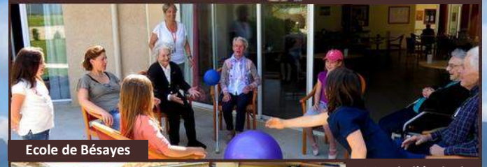
Ecole de Bésayes