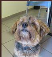
Diva, chienne d'une résidente