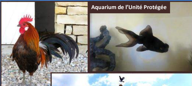
Aquarium de l'Unité Protégée