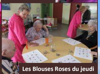
Les Blouses Roses du jeudi

L'intergénérationnel , au cœur de notre projet de vie sociale.