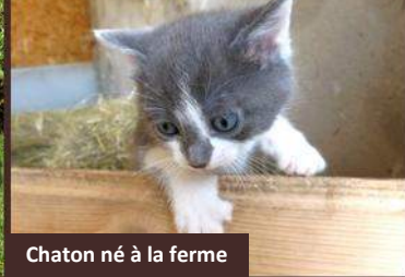
Chaton né à la ferme

Poneys, chiens et chats, poissons, poules et coqs, la médiation animale est une notion importante aux Monts du Matin. Les animaux de compagnie de nos résidents sont également les bienvenues.