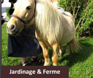
Jardinage & Ferme