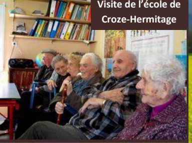
Visite de l'école de Croze-Hermitage