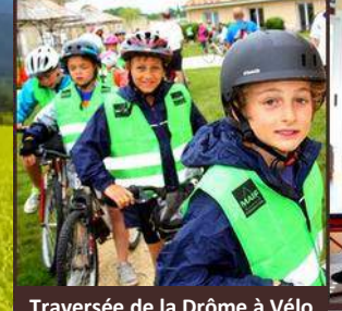
Traversée de la Drôme à Vélo